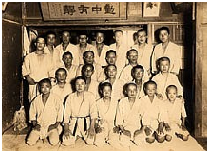
You Shu Kan dojo en 1941

Allí estuvo Kenwa Mabuni hasta la primavera siguiente, momento en que se trasladó a Osaka para evitar así la competencia con Gichin Funakoshi que ya se había establecido en Tokio con anterioridad. En 1934 abrió su propio dojo , en el distrito de Nishi Nari, el “You Shu Kan” y publicó “Goshin Karate Kenpo” (investigación sobre Seipai). Más tarde fundó la asociación “Nihon Karate-Do Kai”, que tiempo después se convirtió en la actual “Shito Kai”. Su dedicación se volcó entonces en la difusión del karate que se hacía en su escuela y en especial en la formación de profesores.