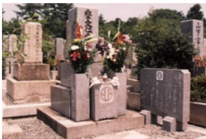
Tumba del Maestro Mabuni Kenwa en el cementerio de Hattori

Kenwa Mabuni murió el 23 de mayo de 1957 a la edad de 64 años.