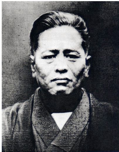
Maestro Chogun Miyagui

Comienza a trabajar como profesor sustituto en la Escuela Primaria de Naha. Durante esta época a la edad de 20 años conoce y traba amistad con Chojun Miyagi, el cual le presentará a su maestro Kanryo Higaonna. Higaonna había marchado de joven a China, donde aprendió el kenpo chino en la ciudad de Fukien, de regreso a Okinawa fundó Naha Te. Así fue como Kenwa Mabuni, gracias a la recomendación de su amigo Choyun Miyagi, pudo aprender directamente de la fuente de Naha Te.