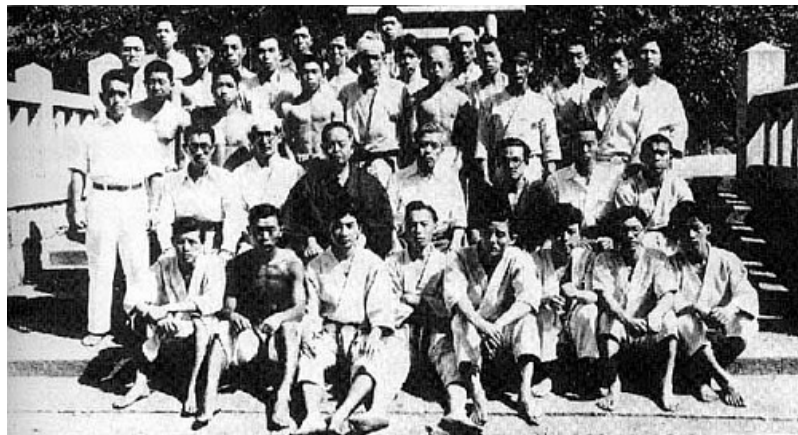
Mabuni Kenwa en Osaka con estudiantes de la época

A partir de ese momento los objetivos del maestro Mabuni y demás maestros de la época, sería hacer desaparecer esa imagen negativa de karate, empezando por crear una mejor estructura general y un Karate educativo pero sin perder su esencia defensiva. Es aquí donde el maestro inicia su sistema o método pedagógico, al que denominamos "MÉTODO MABUNI".